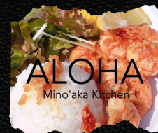
「Mino'aka Kitchen」 ガーリックシュリンプ モチコチキン、レモネード