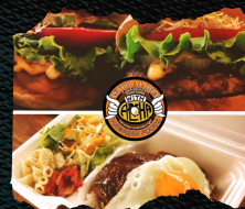
「WITH ALOHA」 ハンバーガー、ロコモコ モチコチキン、チリポテト