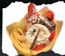
「SUN・POUDRE」 米粉を使用した もちもち生地のカレー