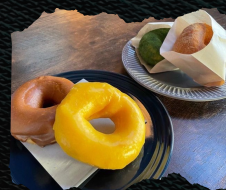
「きつねとたぬき」 米油を使用し、鉄なべで1つ1つ揚げたドーナツ、ブライドポテト